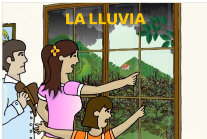
Frente de la tarjeta