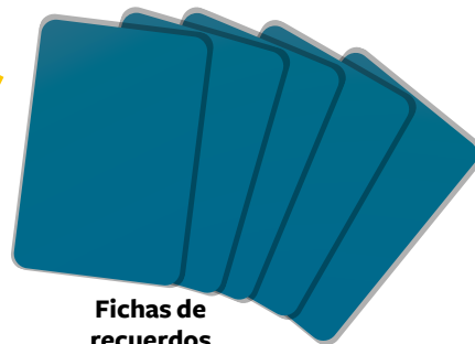
Fichas de recuerdos

Se debe contar con papel bond, marcadores, colores, revistas para realizar el trabajo del dibujo participativo.