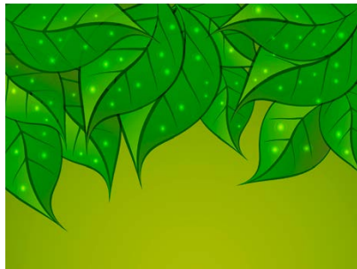
Frente de la tarjeta