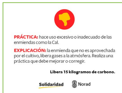
Reverso de la tarjeta