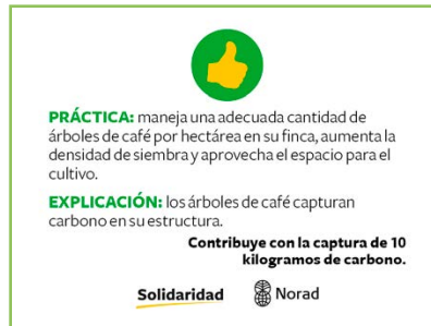
Reverso de la tarjeta