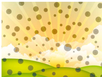
Frente de la tarjeta